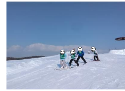
■3・4年スキー【沼田スキー場】