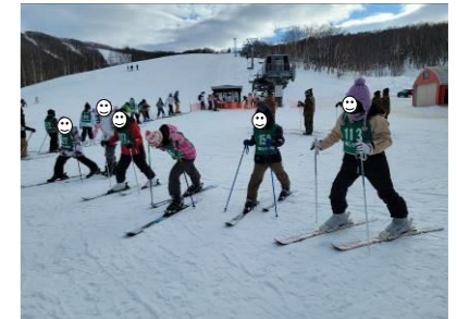
■5・6年スキー【増毛スキー場】