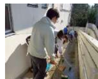
ゆうゆう善福寺館のスロープ掃除ボランティアにでかけました。