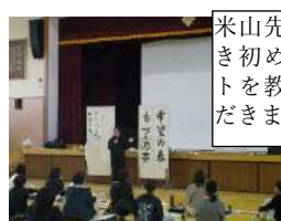
米山先生から書き初めのポイントを教えていただきました。