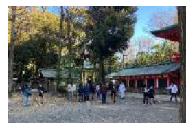
井草八幡宮の落ち葉清掃に出かけ、新年行事の準備のお手伝いをしました。