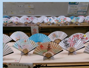
3年生修学旅行「京扇子絵付け体験」で制作した作品

夏休みにしかできない体験をして始業式に元気な姿で皆さんに会えることを楽しみにしています。