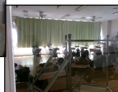
教室内バリケード