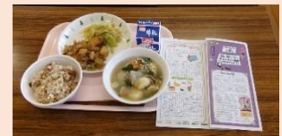
チーズと鰹節のごはん アスパラと里芋と豚肉の照り焼き炒め キャベツの胡麻和え、具だくさん雑煮

読書と給食のコラボによるイベント「第8回泉南ブックカフェ」を12月5日(木)に行いました。今回のテーマ本は駅伝小説「タスキメシ箱根」。3日(火)・4日(水)の朝読書の時間に図書委員が朗読した動画を視聴し、本のガイドペーパーを読んだのち、給食で、テーマ本に登場する「タスキメシ」をいただきました。