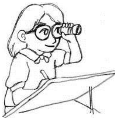
単眼鏡で黒板を見て書き写す学習