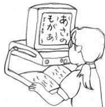
拡大読書器で文字を拡大して読む学習