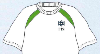
左胸：校章・ネーム刺繍