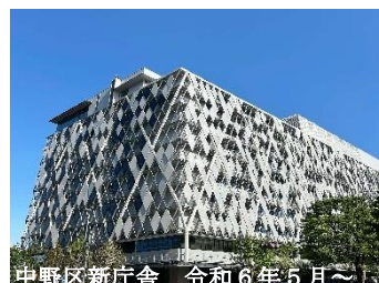
中野区新庁舎 令和6年5月～

東京都のほぼ中央に位置する「中野区」は、都心へのアクセスの良さと、独自の文化が融合した活気あるエリアとして知られている。渋谷や新宿などの繁華街からも近く、交通の便が良い一方で、下町情緒が残る街並みや緑豊かな公園もあり、住みやすい環境が整っている。