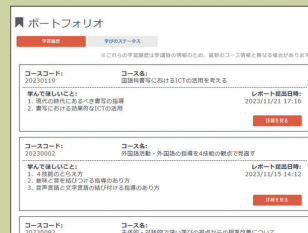
学びのポートフォリオ / 学習履歴 一例