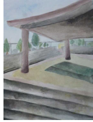
「この伝統 これからもずっと」