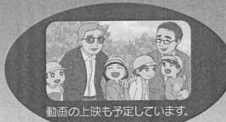
動画の上映も予定しています。