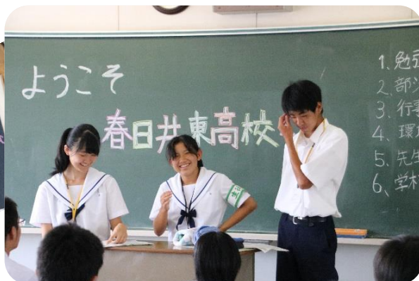
先輩のアドバイス