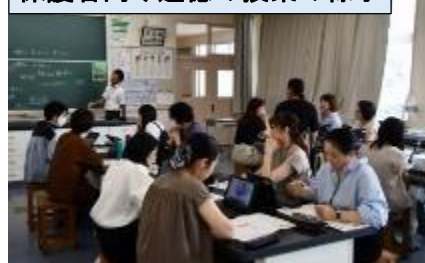
保護者向け道徳の授業の様子

自分の思いは違う、いろいろな意見を聞けた良かった。 何が正しく、間違っているかは、それぞれの人々の思いによっても違ってくるので正解はないと思う。自分のその行動に責任をもち、後悔なく生きていけると思う。