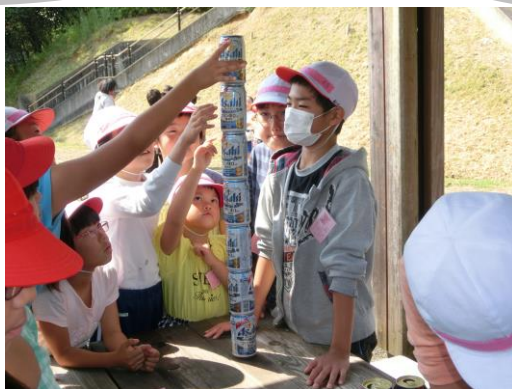
仲良し徒歩遠足での縦割り活動

本校では、異年齢集団による活動を取り入れ、下級生を思いやる気持ちや、上級生に対して感謝する気持ちを育てています。また、各学年に応じた子ども一人一人の役割意識をもたせることにより、共により良く生きようとする行動力と、一人一人の自己存在感を高めています。