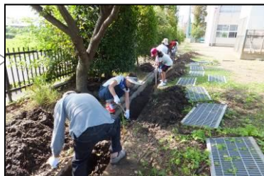
学校での活動の様子

人権週間に学級のスローガンを考えました。「ふわふわ言葉」をたくさん使っていきます。