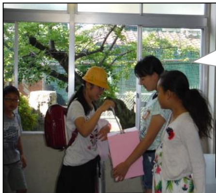
ネパールの地震被災者への募金

〈5・6年生では〉 相手の立場を理解し、支え合う態度を身に付ける。集団における役割と責任を果たし、国家・社会の一員としての自覚をもつ。