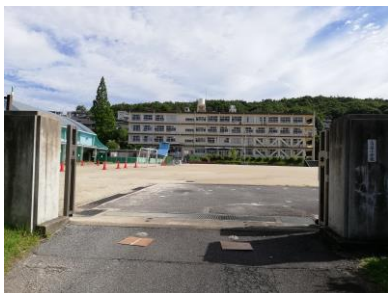
南側の校門から見る校舎

校庭のメタセコイアは、学校のシンボルです。大きな枝を広げ、高座小学校の子どもたちをいつも見守ってくれています。