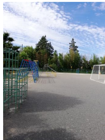
メタセコイア側から見た遊具