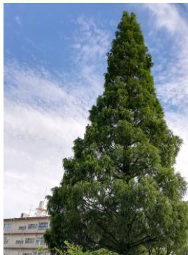
校舎の東側に立つ メタセコイア

校庭のメタセコイアは、学校のシンボルです。大きな枝を広げ、高座小学校の子どもたちをいつも見守ってくれています。