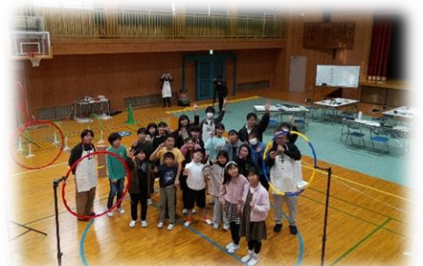
飛ばしたドローンから記念撮影