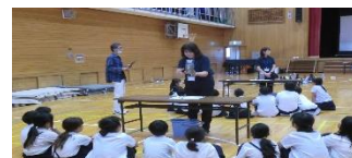
4年出かける浄水場授業