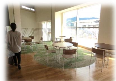
↑コミュニケーションスペース

1階から最上階までの吹き抜けやテラス、窓の配置や大きさを工夫することで、建物の大きさを感じさせない大変明るく開放的な施設でした。また、中庭やメディアセンター、コミュニケーションスペースが設けられ、子どもたちの交流を促すしかけが随所に見られました。