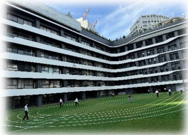
↑屋外運動場と7階建て校舎（外観）