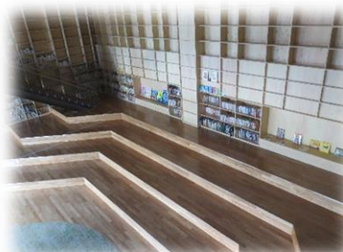
↑メディアセンター