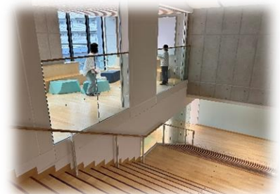
↑コミュニケーションデッキ

狭小な敷地ですが、屋上・屋内運動場を整備することで、運動の場を確保していました。また、階段にコミュニケーションデッキを設け交流を促すしかけが見られました。これらは建物の高層化により、運動量が減少したり、上下階の移動に対して負担感が生じたりすることへの配慮にもなっていました。