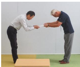
←教育長より委員に 委嘱状を交付

田尻町教育委員会の附属機関であり、学識経験者、保護者代表、地域代表等 8 名から構成された組織として、一貫教育に関する審議を行なうものです。第 1 回会議を 10 月 10 日に開催し、教育長から委嘱を行なったのち、「たじりエンゼル、小学校、中学校を一体化させることの是非について」諮問しました。今後、よりよい一貫校をめざして本格的に審議を進めていきます。