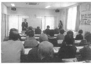
被害者の多くが高齢者といふことで、熱心に聞き入る参加者

「架空請求詐欺」「融資保証金詐欺」等が多く発生しています。特に高齢者(65歳以上)が75%を占めておりうち女性70%です。オレオレ詐欺と還付金等の詐欺では9割超が高齢者です。手口としては詐欺の電話がかかって来る!被害に遭わないためには「留守番電話やナンバーディスプレイを活用する」知らない電話には出ない」「確認すること、相談すること」一人で