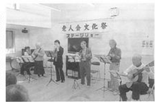
聴衆沸かす楽器演奏

練習を重ねた多彩な演目が次々と披露された。プログラムの内容は定番の太極拳、合唱、マジック、踊り、民話、安来節とじょうずく、合奏、フラダンスの他、人形劇が初登場した。また途中、リラック