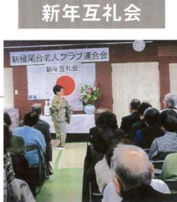
舞踊クラブの祝賀の舞いに参加者の皆さんもうっとり

新檜尾台校区老人クラブ連合会は、毎年新年互礼会を開催しております。今年も1月15日に新檜尾台地域会館