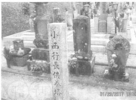
キリシタン大名として有名な武将、小西行長の供養塔が 泉北丘陵にひっそりと佇む

高学歴、高収入がある かと思われる人にも多い。 老人クラブの仲間達 と共に語り合う喜び、 楽しみを共有出来ない 人達の、人生のしあわ せの薄さ少なさに大き な残念さを感じていま す。東北・熊本のように