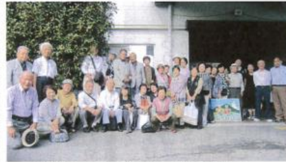
温泉と自然の恵みを堪能した皆さん

9月30日、富田林サバファーム・富田林かんぼの宿を実施した。相次ぐ台風襲来や秋雨前線の長い停滞で天候が心配されたが当日は秋晴れの青空が広がる行楽日和に恵まれた。バスの車窓からは穂り入れを前にした田んぼの畦を独占めして咲く真っ赤な彼岸花の