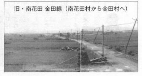
旧・南花田 金田線(南花田村から金田村へ)

に編入されて水路の改善により浸水がなくなりまし。大泉池から出た水路も、北と西に河川幅の拡張と道路幅で南花田町側は暗渠に、地域が大きく改善されました。