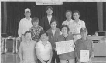
第3位 東三国ヶ丘校区堺なでしこ