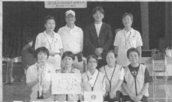
優勝 光電寺校区 3&3 チーム