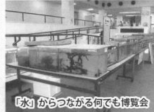
「水」からつながる何でも博覧会

平成十八年一月、第十四回「私の水辺」泉北地域交流会の「水」からつながる何でも博覧会に参加して、淡水魚を二十種類ほど入れた十数個の水槽を展示しました。 昨年三月には、堺市役所本庁高層階ロビーにて、堺市生涯学習交流サロン活動展にも「イケボタルとゲンシボタルの幼虫と川魚を展示しました。今年も三月に