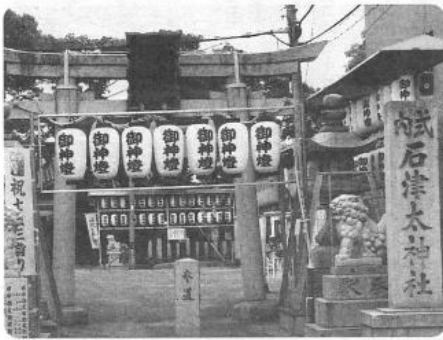
▲石津太神社は日本最古の戎社で、孝昭天皇7年(紀元前469年)8月に建てられ、蛭子命(ひるこのみこと)戎大神を祀っています。▼ヤッサイホッサイ祭りは、蛭子命を薪を焚いて助けたという故事に則り、12月14日に行われる火渡り神事です。