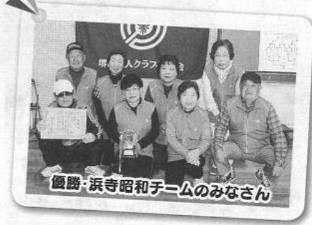
優勝・浜寺昭和チームのみなさん