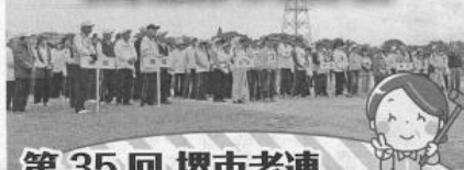
第 35 回 堺市老連 ゲートボール決勝大会

市老連主催「第35回ゲートボール決勝大会」が10月21日、秋晴れの金岡公園野球場で開催され、各区の予選を勝ち抜いた41チームが出場しました。