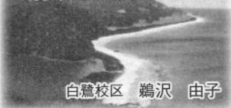
白鷺校区 鶴島 由子

「山陽新幹線さくら」に初めて乗り、熊本駅で下車。震災で被害を受けた熊本城は天守閣や城の中への立ち入りが禁止で、私たちは西側にある二の丸広場からお城を眺めました。奥に見える