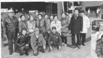
登美丘南二十八人、八下西十三人、白鷺十人、登美丘西九人、登美丘東五人の合計百四十六人でした。

百四十六人が四台のバスで楽しい一日をすごしました。午前八時ごろ区内四カ所から出発、まず清荒神清澄寺に参拝、そのあと西宮市の塩田八幡宮に参拝、今年の安全祈願をしました。昼食は東条湖畔で招福ご勝を楽しましました。午後はめんたいパーク神戸三田工場、灘の甲南演資料館、神戸佃煮工房を見学、ショッピングを楽しみました。最後に西宮市の廣田神社を参拝、家内安全、阪神タイガース(他の十一球団も)の優勝祈願をして初詣を締めくくりました。各校区の参加者は日置庄四十三人、野田三十八