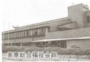
美原総合福祉会館