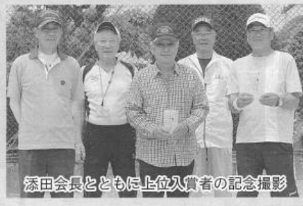
添田会長とともに上位入賞者の記念撮影