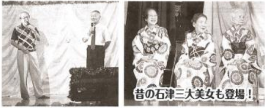
昔の石津三大美女も登場!