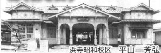
浜寺昭和校区 平山 芳弘

前号でもお知らせのとおり、計画はかなり遅れていますが、曳家が11月末に実施されるので、地元(まちづくり協議会)では、11月19日に「曳家の記念行事」が行われます。駅舎の移設後、内装工事等を行い、3月中旬に諸設備を搬入、いよいよオープン運びとなる予定です。