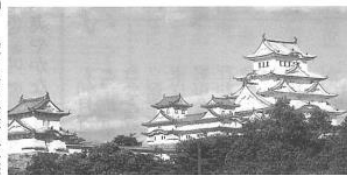
化粧直しされた姫路城

南区老連では10月4日、参加者105人で姫路城、塩田温泉へ秋季親子旅行を実施しました。姫路の奥座敷・塩田温泉「夢乃井」で昼食