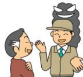
(消費者庁イラスト集より)

報告されています。不要な工事や商品の勧誘は、はっきり断り、執拗な業者に対しては警察に通報しましょう。また、契約のトラブルなどについては消費生活センターに相談してください。