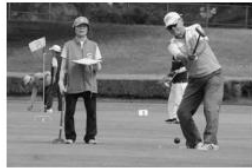
秋晴れの下、各区の代表217人が日頃の練習の成果を競いました。