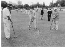
9月14日(木)、金岡公園陸上競技場で「第16回堺市老連ゴルフウインドゴルフ決勝大会」を開催しました。