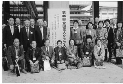
堺市老連からは23人が参加