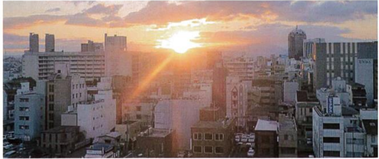
(撮影)ホテルゴッラ リージェンシー堺26階より