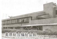
美原総合福祉会館