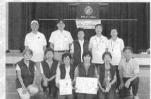
準優勝 金岡校区長曾根Aチーム