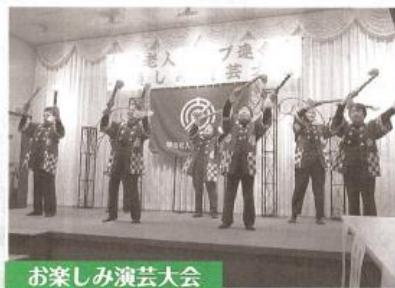
お楽しみ演芸大会