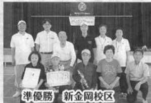
準優勝 新金岡校区 新金岡Aチーム