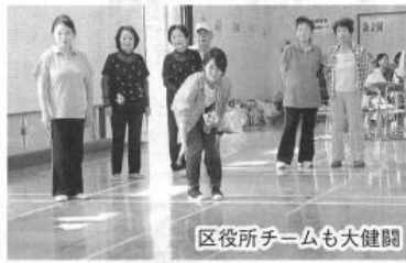
区役所チームも大健闘

試合中は皆ゲームを楽しみながらも真剣な表情。逆転に成功したチームからは「よっっ」うまっくいったわ」と喜びの声や拍手が聞こえます。空き時間も次の対戦について話合ったり、投げ方を練習したりと、熱心な様子があつた。