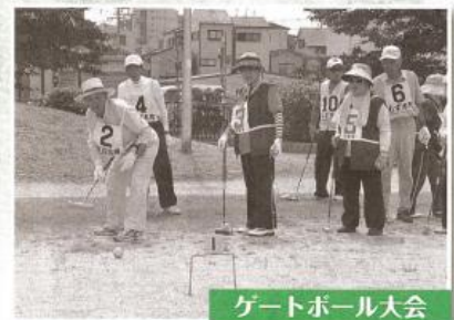
ゲートボール大会