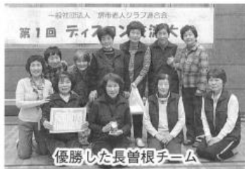
優勝した長曾根チーム

*大会結果 優勝 長曾根(北区) 準優勝 鳳南(西区) 第三位 錦アヤンチャース堺区