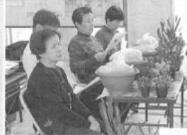
解説の後は寄せ植えに挑戦