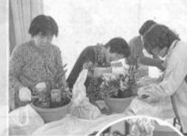
あっという間に素敵な寄せ植えが完成!