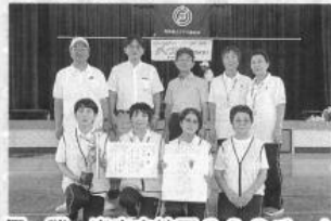
優勝 光竜寺校区3&3チーム