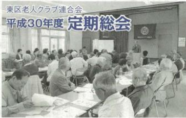
東区老人クラブ連合会 平成30年度 定期総会