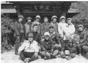
梅香や今は昔の里の家 木坊