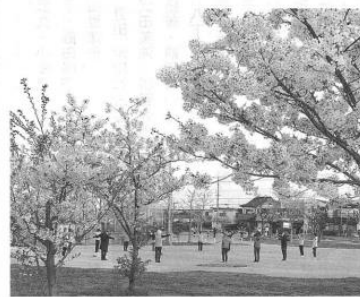
八下西 ラジオ体操で鍛えています

各校区・単位クラブの活動の様子を掲載します。季節にちなんだ行事・地域での取り組み・人気のサークル活動等、皆さんの日頃の活動の様子をご投稿ください。それぞれの活動状況を参考に、校区・単位クラブの活動をさらに充実させましょう!