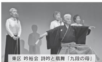
東区 吟裕会 詩吟と扇舞「九段の母」

定時社員総会第2部では、各区老連より芸自慢のグループが舞踊などを披露。日頃の練習の成果が花開き、会場の会員から拍手喝采の大盛り上がりとなりました。