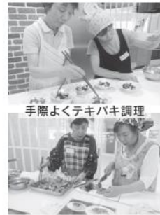
手際よくテキパキ調理