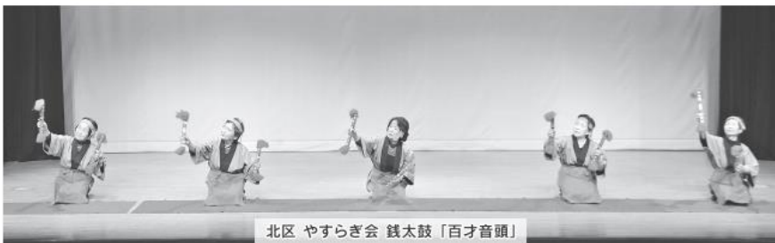
北区 やすらぎ会 銭太鼓「百才音頭」