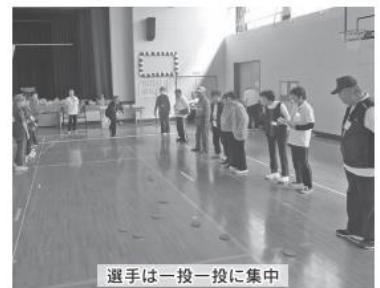
選手は一投一投に集中