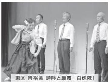
東区 吟裕会 詩吟と扇舞「白虎隊」