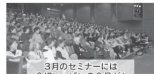
3月のセミナーには会場いっぱいの会員が!

開催しています。29年度第1回は「顔筋のエクササイズ」、第2回は「堺コッカラ体操」で、顔の筋肉の運動や体操によって脳の活性化を促しました。また、第3回は大阪府警の