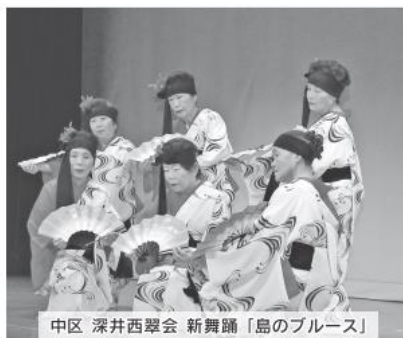
中区 深井西翠会 新舞踊「島のブルース」