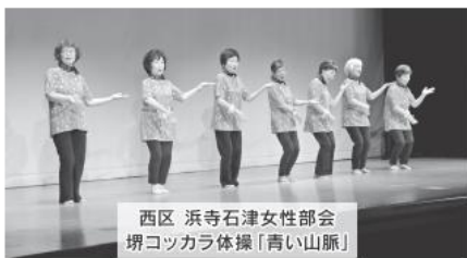
西区 浜寺石津女性部会 堺コツカラ体操「青い山脈」