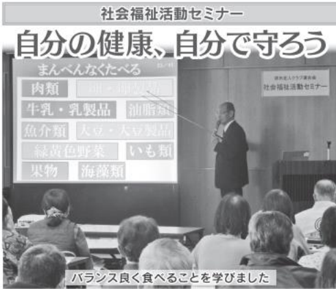
バランス良く食べることを学びました

社会福祉活動セミナー 「医療」など高齢者が抱える問題を理解する ため、市老連社会福祉部会が毎年2月と3月に4回開催しています。