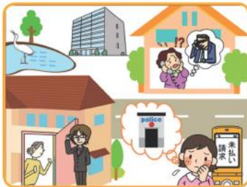
まちがいは全部で5ヶ所