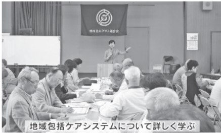
地域包括ケアシステムについて詳しく学ぶ

4月28日、日置荘校区原寺公民館で東区老連総会を開催し、単位クラブ会長、女性部会員、若手委員44人が出席しました。