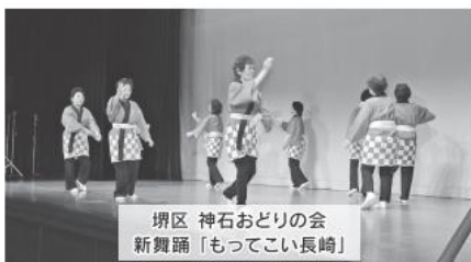
堺区 神石おどりの会 新舞踊「もってこい長崎」