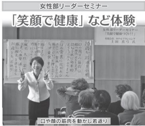
口や顔の筋肉を動かして若返り

女性部会活動の活性化と会員の新たな知識の習得をめざし、毎年12月、2月、3月の3回「女性部リーダーセミナー」を