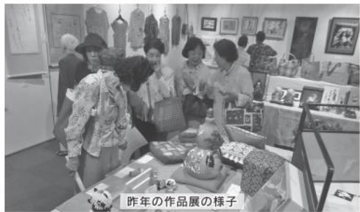
昨年の作品展の様子

【開催日時】7月6日(金)~10日(火) 午前10時~午後5時まで ただし 7月10日(火)の展示は午前10時~午後1時まで