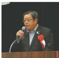
竹山市長からの祝辞

5月30日午後1時30分から、平成30年度「一般社団法人堺市老人クラブ連合会定時社員総会」が堺市総合福祉会館6階ホールで開催されました。