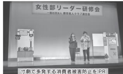
寸劇で多発する消費者被害防止をPR

皆さんによる「高齢消費者被害防止」に向けた講演と防犯劇で、防犯意識を高めました。