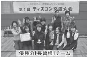
優勝の「長會根」チーム