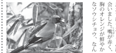
写真はカケスのもまね上手で、「ジューイ」と鳴く

透き通つた歌声のイカル、イソヒヨドリ。賑やかな鳴き声のヒヨドリ、シジュウカラ、ヒバリ。目尻が上がリキリとしたゴジュウカラ。色のきれいな鳥たちにもたくさん出会いました。嘴が赤く、胸のオレンジが鮮やかなソウシチョウ、なん