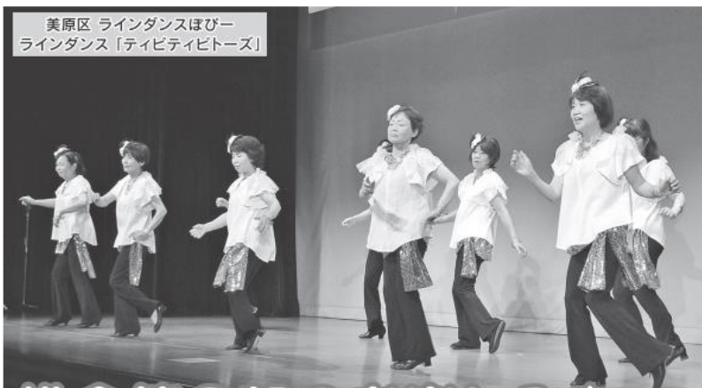
美原区 ラインダンスほびー ラインダンス「ティビティビトース」