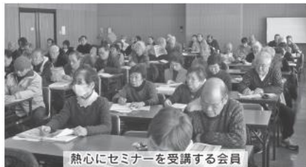
熱心にセミナーを受講する会員

29年度は、「自助」をテーマに自分の健康を自分で守るための「食と健康」について、食品メーカーや医師、歯科衛生士の方に講演をお願いしました。また、3区の代表の方から日頃の老人クラブ活動の事例発表もいただきました。