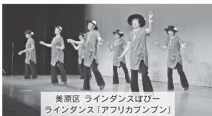
美原区 ラインダンスほびー ラインダンス「アフリカブンブン」