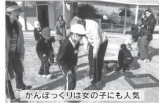
かんぼっくりは女の子にも人気

2月16日に西陶器小学校において、1、2年生の生活科の学習の一環として、児童と校区老人クラブの会員との「昔の遊び」の交流会を行いました。