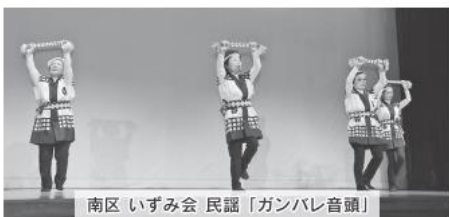
南区 いずみ会 民謡「ガンバレ音頭」