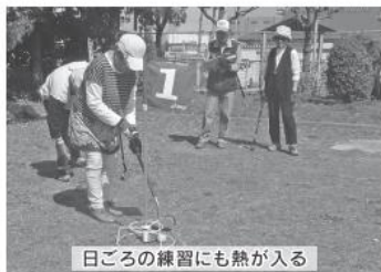
日ごろの練習にも熱が入る

終了後に児童から「西陶器小学校」校歌の熱唱と、全員で童謡「雪」を合唱し、我々も童心に帰る楽しい時間を過ごすことができました。