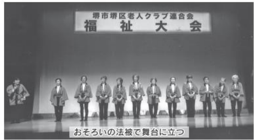
おそろいの法被で舞台上立つ

た。女性部も踊りをはじめ6年目をむかえました。一年一年、私たちも踊る楽しさが出てきたようです。今年には着物はなく、女性部のネーム入り法被を新調しました。気分もあらたに張り切って踊ったつもりです！