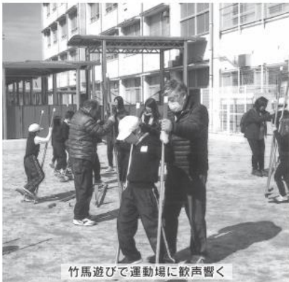
竹馬遊びで運動場に歓声響く

特にリムまわし、竹馬、コマまわし、けん玉等の遊びは「コツ」を呑み込むように何度も何度も繰り返し指導し、汗だく。上手にできたり、失敗したりで児童と一緒に「喜ぶ」愛しい笑顔で「お願いします」「ありがとうございます」の声を忘れて頑張りました。