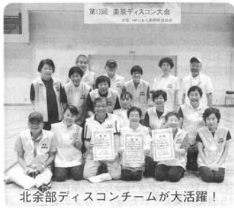
北余部ディスコンチームが大活躍!

また、老人クラブ以外にも福祉会館チームなど多くの団体が参加しており、それぞれ虎視眈々と優勝を狙っています。