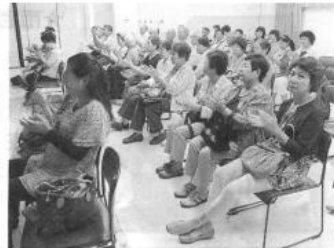
私たちは、堺市美原区老人クラブ連合会の活動を応援しています

美原区老連主催 教養講座 開催決定 美原区老連主催の教養講座を、九月十二日(木)午後一時半から美原総合福祉会館にて開催します。 今回のテーマは「知って得する！消費者トラブル豆知識」。堺市生涯学習まちづくり出前講座を利用し、消費生活センターから講師を招いてお話を伺います。高齢者を狙った強引な電話勧誘販売や訪問買取りなどの消費者トラブルが年々増加傾向にあり、被害額も大きくなっています。そこで、実例を交えながらどのように対処すれば被害を防げるか、分かりやすくレクチャーしていただきます。皆さんも「自分は大丈夫」と思わず、ぜひご参加ください。