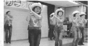
カントリーハッピースマイル