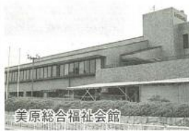
美原総合福祉会館