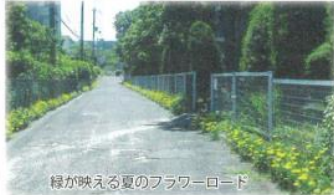
緑が映える夏のフラワーロード