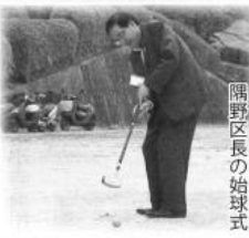
隅野区長の始球式