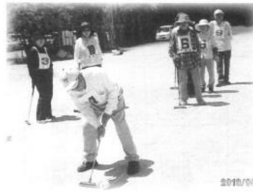
75回区老連ゲートボール大会

優勝 宮山台C 2位 釜釜 3位 逆瀬川 4位 鉢ヶ峯B 5位 宮山台B 6位 泉田中A 7位 梅A 8位 鉢ヶ峯A 9位 緑ヶ丘 10位 畑 (以上のチームの内8チームが堺市老連大会に出場します)