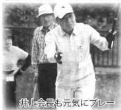
第1回会長も元気にプレー