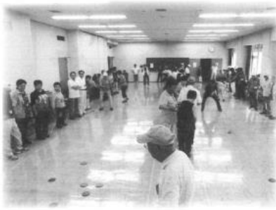
南区ディスコン交流会 区長杯開催目指して

「ナイスショット」思わずガッツポーズやハイタッチ。南区ディスコン交流会が6月24日、梅文化会館で9校区14チーム約90人が参加して行われました。試合結果よりも交流