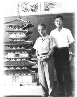
津山工高に保存されている薬師寺東塔の精密模型。写真中央が宮大工の父

リカ・ニューヨーク州の空港で日本文化紹介の一翼を担う。 現在は、社寺建築の永遠の教材として工高の展示室に保存されている。また年一回の市民展で紹介されている。 一方、息子の私はどうか。幼い頃から不器用で父を悩ませた。ある日、棟梁の跡を継ぐ継がない