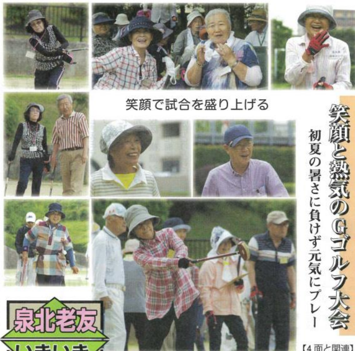
笑顔で試合を盛り上げる