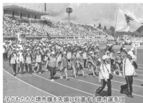
子どもたちと堺市旗を先頭に行進する堺市選手団

「ねんりんピック」の愛称で親しまれている「全国健康福祉祭」は、六十歳以上の高齢者を中心にスポーツ競技や美術展、音楽文化祭などのイベントや、健康福祉機器展、子どもフェスティバルなど、あらゆる世代の人たちが楽しみ、交流を深めることができる健康と福祉の総合的な祭典です。ねんりんピックは、健康および福祉に関し積極的