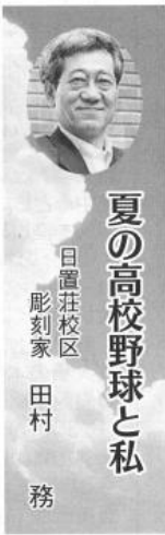
夏の高校野球と私 日置荘校区 彫刻家 田村 務