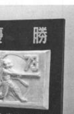
優勝 校会 高等学校 全国 野球選手権大会