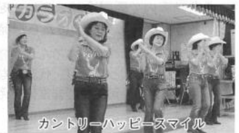
カントリーハッピースマイル