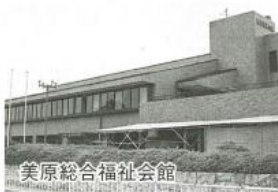
美原総合福祉会館