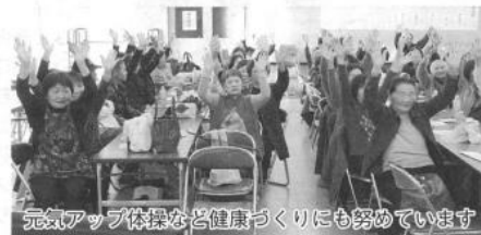
元気アップ体操など健康づくりにも努めています