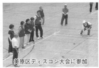
美原区ディスコン大会に参加

入会していたくは難しく、新規に入会していたたいても過去や施設入所などによる減少をとめるのが精いっぱいでした。そこで現在の役員で話し合いを行い、平成二十九年年度に自治会に対して、自治会員の老人クラブへの加入について全面的な協力を依頼しました。自治会も地域における老人クラブの果たす役割を評価し、財政的な協力もいたただけることになり、その結果、会員からの年会費を廃止することができました。