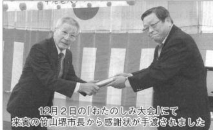
12月2日の「おたのしみ大会」にて来賓の笹山堺市長から感謝状が手渡されました