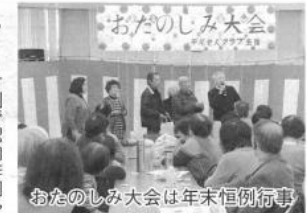
おたのしみ大会は年末恒例行事

②老人クラブの活動について 私たちのクラブは、「健康」「学び」「楽しく」をキーワードに、社会福祉委員、民生委員、老人クラブ役員が協力し、一体となって活動しています。