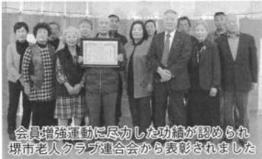
会員増強運動に尽力した功績が認められ堺市老人クラブ連合会から表彰されました

美原区は鉄道も駅もない所ですが、バス・車は便利な所です。人口は三万八千三百人、世帯数は一万四五百一十六世帯、校区は六校区・二十六地区あります。平尾校区には六地区あります。