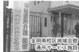
金岡南校区地域会館 通所サービス施設