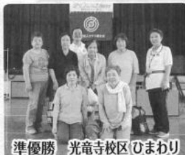
準優勝 光電寺校区ひまわり