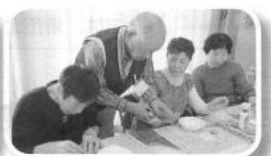
分かりやすく丁寧に教えていただきました