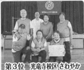
第3位 光電寺校区さわやか