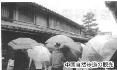
中国自然歩道の観光

で変更。中国自然歩道の松 阪邸、書状集箱ポスト明治 四年(郵便事業創業当時と 同じ型)ほかを観光し、竹 原港からフェリーに乗船 大崎上島垂水港まで約二十 分遊覧する。雨のため島々 の景色が霞み残念。バスは きのえ温泉ホテル清風館に 到着。