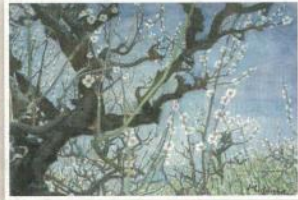
水彩画「春近し」 百舌鳥校区 増田伏佐子