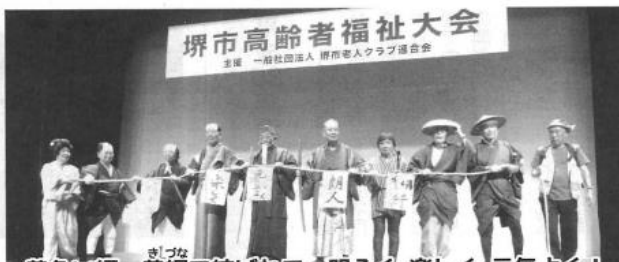
黄色い綱、黄綱で結ばれて、明るく・楽しく・元気よく!

昨年十月四日に開催された「高齢者福祉大会」の北区の各校区老人クラブ会長によるアトラクションが大変好評でありましたので、今一度、その内容を教えてくださいとの声があり、この紙面を借りてシナリオを再現しました。 なお、衣装は持ち寄り、小道具は一〇〇均の店で手配しました。