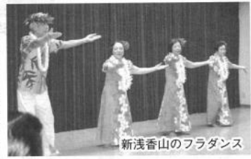
新浅香山のフラダンス

午後八時三十分開会(各 校区長と研修旅行部会委員 の紹介、社会長のあいさ つ、祝電披露、東三国丘・ 森田会長の乾杯で懇親に入 る。「瀬戸内海」で育まれ た海の幸を頂く。 カラオケが始まり、十番 目に新浅香山校区のフラダ ンスがあり、最後十八番目 に社会長の「河内おとご節」 となり、高田副部会長のあ いさつで宴会終了。