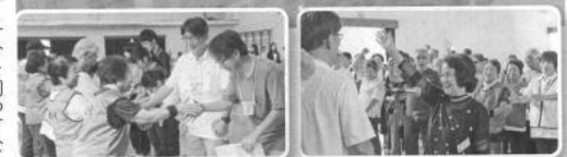
九月二十三日(日)、第三回区長杯デイスコン大会が、光電寺小学校体育館で開催されました。

北区役所の二チームを含む全二十四チーム一四九人が参加し、四コートに分かれ、リーグ戦方式で競い合いました。 大会は新金岡校区水仙チームが見事優勝に輝きました。