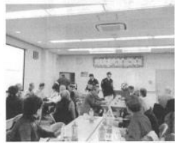
区で頻りに発生している詐欺事件につき、お話をしていたいただきました。「オレオレ詐欺に続きもつと巧妙なキャッシュカードをすり替える手口」で、百貨店・家電量販店店員を名乗り、「あなたのカードが悪用されているので、銀行協会の係員を差し向けるので、カードを渡してください。新しいカードと交換しますの。カード番号を係員に教えてください」と言われて偽のカードとすり替えるというお話でした。皆さん真剣な顔で聞き入っていました。大事な老後のお金で

平成三十年は豪雨水害、地震、猛暑、台風など、各地に大きな爪痕を残し、過ぎ去りました。三十二年度は穏やかな良い年であってほしい。