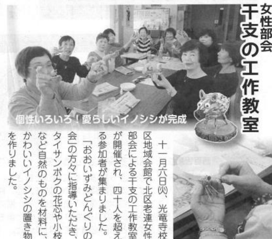
個性いろいろ！愛らしいイノシシが完成

十一月八日(日)、光電寺校区域会館で北区老連女性部会による干支の工作教室が開催され、四十人を超える参加者が集まりました。 「おおいずみどんぐりの会」の方々に指導いただき、タイサンボクの花芯や小枝など自然のものを材料に、かわいいイノシシの置き物を作りました。