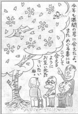
東三国丘校区 山中 弘之