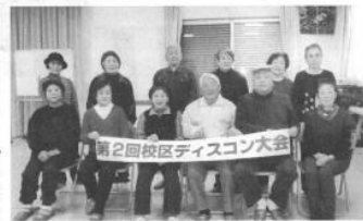
第三回単位クラブ交流大会を「すこやか老友」で報告することを楽しみにしております。