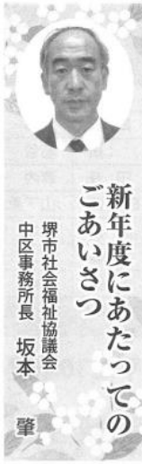
新年度にあたってのごあいさつ

堺市では、高齢になつても住み慣れた地域で自分らしくいきいきと暮らす社会の実現をめざして、昨年十月に堺