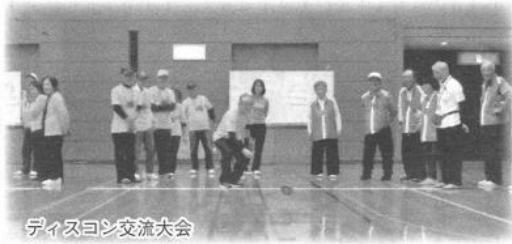
ディスコン交流大会