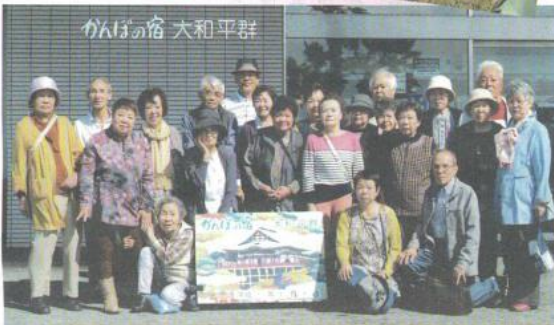
年に一度の泊旅行