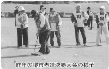
昨年の堺市老連決勝大会の様子

なお、今大会に参加したチームは10月31日(日)に開催予定の堺市老連決勝大会に出場します。