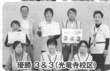
優勝 3 & 3 (光竜寺校区)