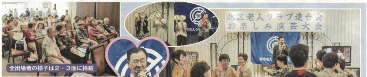
全出場者の様子は2・3面に掲載