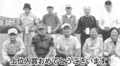
上位入賞おめでとうございます!

の転がり具合を見定めて慎重にプレーしていきます。狙い通りのショットには、思わず「よっしゃ、いったでー」や「ナイスショットや」など、元気いっぱいの声が青空の下に響き渡りました。