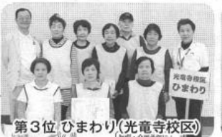
第3位 ひまわり(光竜寺校区)