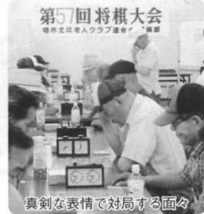
真剣な表情で対局する面々

六月二十三日(日)、新金岡市民センターにて三十一人の参加者が四クラスに分かれて対局が行われました。