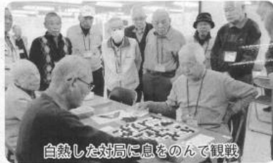
白熱した対局に息をのんで観戦