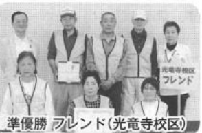
準優勝 フレンド(光竜寺校区)

五月十六日(日)、金岡公園野球場にて第十二回北区老人クラブ連合会クラブラウンドゴルフ大会が開催され、参加した二四人が八ホールミラウンドをプレーしました。開会式では社会長が「暑いですが、ぜひ楽しんでください」とあいさつを行い、集まった参加者にエールを送りました。ゲームが始まると、まるで初夏のような日差しが差し込む同公園のグラウンドで、皆さん芝の長さや砂地の