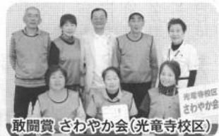
敢闘賞 さわやか会(光竜寺校区)

行われるなど、試合開始前からすでに大盛り上がり。大会は前半を終えた時点でいくつかのチームに優勝の可能性を残し、勝負となる後半戦に突入。皆さん最後の一投まで全力でプレーして、親睦大会を楽しみました。