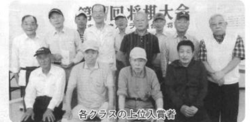
各クラスの上位入賞者