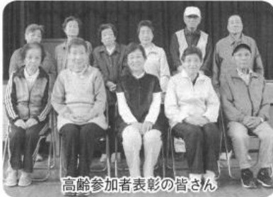
高齢参加者表彰の皆さん

四月二十八日(日)、光竜寺小学校体育館において第六回ディスクコン親睦大会が開催され、二十六チーム(二六八人)が参加。それぞれ四対戦で熱戦を繰り広げました。