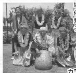
カラオケでは自慢の歌声を披露しました！

5月19日(日)、浜寺公園中央噴水広場周辺で浜寺ローズカーニバルが開催されました。今年も男性6人が可愛い(?)フラガールに変身し、フラダンスを踊りました！