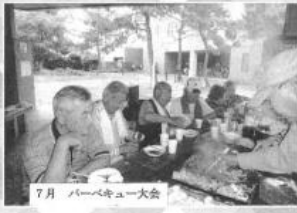
7月 バーベキュー大会