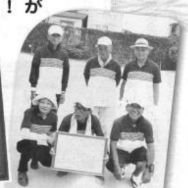
浜寺石津Bチームのみなさん、優勝おめでとうございます！

各コートで快音響かせ熱戦が繰り広げられた結果、浜寺石津Bチームが総合優勝を果たし、堺市長から優勝カップと賞状を授与されました！