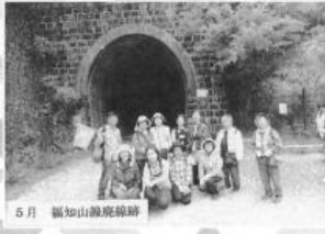
5月 福知山線廃線跡