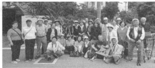
私たちは、堺市西区老人クラブ連合会の活動を応援しています