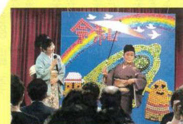
上の写真は校区老連の新春カラオケ大会の1コマ