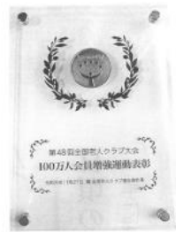
優良クラブ賞を受賞。これからは会員増強運動を推進し、協力をお願いします！