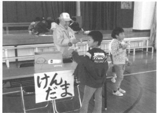
子ども達も楽しんでいるようです

11月12日(火)宮山台小学校体育館において、福祉委員会と宮山台老人クラブ合同で昔の遊びを行いました。小学1年生と年1回の行事として、本年度12回開催となります。各グループにわかれてこま回し、縄跳び、竹とんぼ、けん玉、お手玉その他の種目を、1時間余りの時間交代で回っておぼえています。はやくおぼえる子供もあれば、こま回し、けん玉とか難しいのは途中でやめる子もいます。時間も終わり1年生の代表者からお礼の