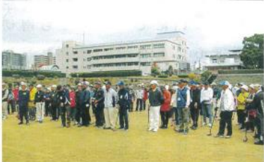
133人が参加してグラウンドゴルフ楽しむ