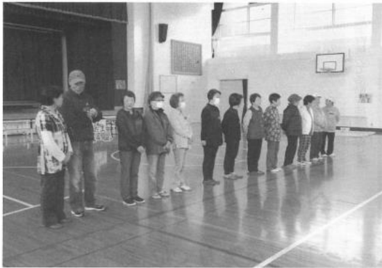
年1回、12回も続いている地域の大切な行事のひとつ

11月12日(火)宮山台小学校体育館において、福祉委員会と宮山台老人クラブ合同で昔の遊びを行いました。小学1年生と年1回の行事として、本年度12回開催となります。各グループにわかれてこま回し、縄跳び、竹とんぼ、けん玉、お手玉その他の種目を、1時間余りの時間交代で回っておぼえています。はやくおぼえる子供もあれば、こま回し、けん玉とか難しいのは途中でやめる子もいます。時間も終わり1年生の代表者からお礼の