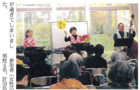
女性部研修会で「もんたった」の美しい歌声を楽しむコンサート開催。参加者全員うっとり...

11月22日(金)午後1時から、赤坂台地域会館にて「もんたった」によるコンサートを開催しました。「もんたった」は、男性1名、女性2名のトリオです。当日の演奏は昔懐かしい曲が中心で、「もんたった」の美しい声に全員が口ずさんだりして、日頃のストレスも吹きとぶ楽しさで、アツという間に1時間余