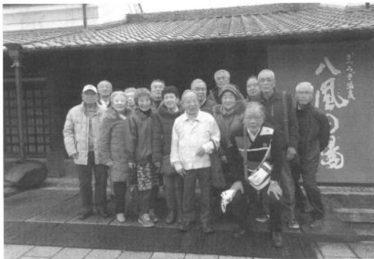
かつらぎ温泉で楽しい新年互礼会を実施