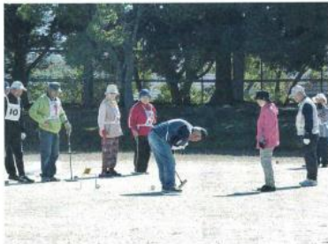
和気あいのゲートボール大会

第75回秋季ゲートボール大会 11月5日(木)、庭代台グラウンドで「第75回ゲートボール大会」を開催しました。 参加申込み18チームのところ棄権2チーム、開催しました。 天候も秋晴れのなか、各チーム日頃の練習の成果を発揮され、