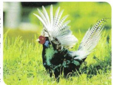
美木多校区・大森地区の空き地に舞い降りた雉

が過す日々の生活の中に根付かせていくことが大切であると感じています。堺市では心身の向上に向けての「介護予防あ・し・たプロジェクト」をうまく循環させるこ