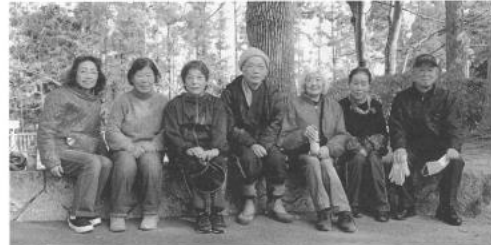
地道な努力で活動の活性化めざす