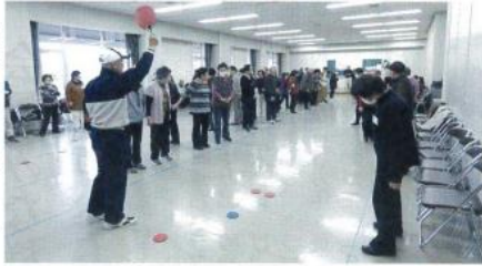
高齢者にぴったりのデイスコン