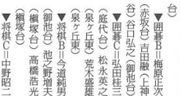
真剣な表情で盤上の熱戦を展開する