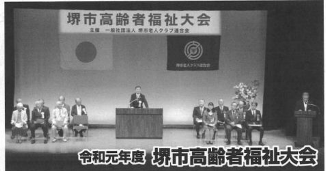
令和元年度 堺市高齢者福祉大会

堺市老連主催による令和元年度堺市高齢者福祉大会が令和元年十月三日(木)、堺市総合福祉会館六階ホールで盛大に開催され、市内七区から大勢の会員が参集しました。第一部式典では、開式