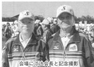
会場にて連会長と記念撮影

各組では他府県選手とのふれあい、方言で会話される選手たちと楽しくプレーができ、またいろいろな経験もした二泊三日の「ねんりんピック紀の国わかやま2019」、収穫の多い大会でした。