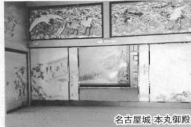
名古屋城 本丸御殿

名古屋市内に 入ります。車 窓から眺めつ つ、昼食地であ る千種区サ ッポロビール 名古屋工場跡 の「浩養園」 へ直行。広々 とした雰囲気 の中、バーベ キューです。 地ビールで乾 杯！腹具合 にちょうど良 し。 名古屋最初 の見学は尾張 の鎮守社「熱 田神宮」。伊勢 神宮に次ぐ大 社で、三種の 神器の「草薙神剣(くさ なぎへのみつるぎ)」が 祀られ、新天皇の奉祝ム ードの本宮を参拝しまし た。別宮・摂社・末社の ほか、「ごころの小徑」 などいろいろパワースポ ットがあるようで、神聖 な「ごころの小徑」と摂 社「一之御前神社」、末 社「清水社」を参拝しま した。