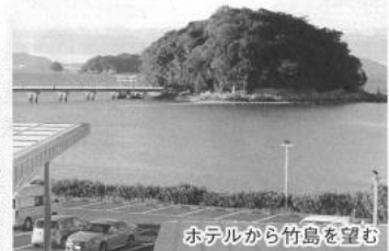
ホテルから竹島を望む

連続で、時間が足り ず急いでバスに戻る こと。 今宵の宿・蒲郡温 泉へ直行。「ホテル 竹島」は「プロが選 ぶ日本のホテル・旅 館100選」に三年 連続受賞とか。国の 天然記念物「竹島」 を前面に押し、風呂 は美人の湯で竹島を望み 素晴らしい。夕食は三河 湾のとれとれの魚が盛り 付けられ、乾杯の音頭で 開宴。燗の日本酒がよく 合い、五臓六腑に染みわ たる！楽しい歌の披露 が続く。会場は和やかに。 今回は上坂市老連事務 局長が初めて参加され、 飛び入り出演で湧き上が る。最後はやはり社会長 の十九番「河内おどご 節」！踊りの輪が会場