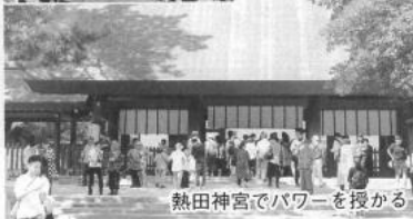
熱田神宮でパワーを授かる

名古屋市内に 入ります。車 窓から眺めつ つ、昼食地であ る千種区サ ッポロビール 名古屋工場跡 の「浩養園」 へ直行。広々 とした雰囲気 の中、バーベ キューです。 地ビールで乾 杯！腹具合 にちょうど良 し。 名古屋最初 の見学は尾張 の鎮守社「熱 田神宮」。伊勢 神宮に次ぐ大 社で、三種の 神器の「草薙神剣(くさ なぎへのみつるぎ)」が 祀られ、新天皇の奉祝ム ードの本宮を参拝しまし た。別宮・摂社・末社の ほか、「ごころの小徑」 などいろいろパワースポ ットがあるようで、神聖 な「ごころの小徑」と摂 社「一之御前神社」、末 社「清水社」を参拝しま した。