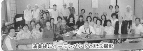
演奏後にイーモンバンドと記念撮影

賓の方もお祝いの言葉を述べ、皆さん笑顔で食事を楽しまれました。昼食後に堺近辺の老人ホームに慰问などを行っているアマチュアバンド、イーモンバンドが登場。「アメイズング・グレイ