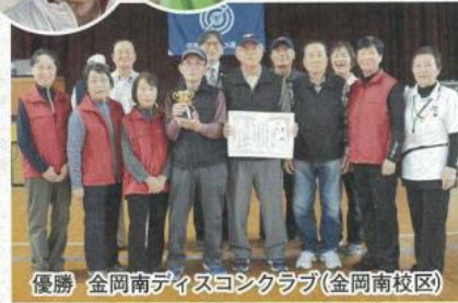
優勝 金岡南ディスコンクラブ(金岡南校区)