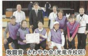
敢闘賞 さわやか会(光電寺校区)