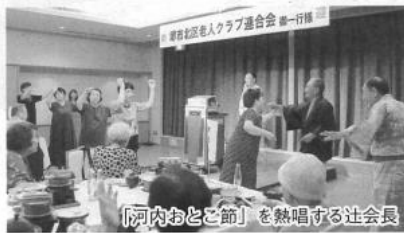
「河内おどご節」を熱唱する社会長

次に、金鯱を頂く五層 五階の天守「名古屋城」 へ。まずは名古屋城をパ ックに全員の記念写真を 石田部会長が撮影。城内 見学はできない ので、本丸御殿 を見学。一昨年 に十年の歳月を かけて復元工事 が完了したはば かりで、長蛇の列 に並びました。 四〇〇年前の姿 が忠実に再現さ れ、絢爛豪華な 調度ばかりなの で立ち止まりの