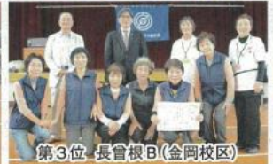
第3位 長曾根B(金岡校区)