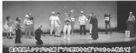
喜多若朗人クラブの寸劇『プロ野球今と昔'テヨちゃん教えて』

表彰式終了後は、参加者全員で万歳三唱を行ない、閉式のご挨拶は第一部式典は幕を閉じました。