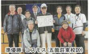
準優勝 コスモス(五箇荘東校区)