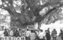
樹齢約千年の大桐

1時間後に2番目の神社へ出発。35分程度の走行で南淡路市の自凝島神社に到着。自凝島神社は、伊弉諾・伊弉冉の国生みの聖地と伝えられる丘にあり、古くからのご息所と親しまれ、崇敬されてきました。古事記・日本書紀によれば、神代の昔、国土創世の時に二神は天の浮橋にお立ちになり、天の沼矛をその矛より滴る潮が、おのずと凝り固まって島となる。これが自凝島である、と書かれています。大鳥居に一礼して潜り、正殿に参拝。この大鳥居は