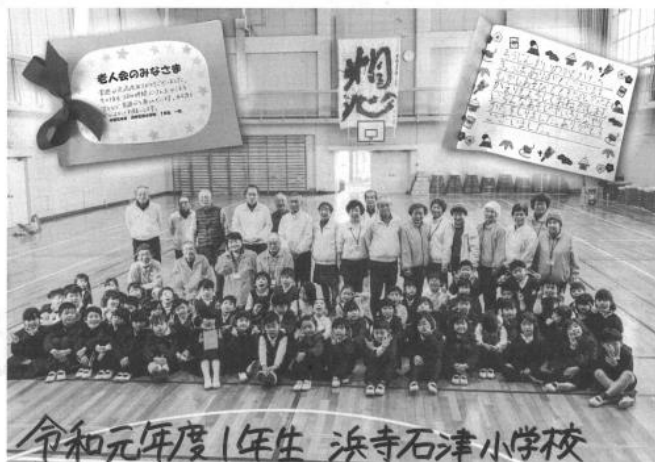
令和元年度1年生 浜寺石津小学校

手玉は女の子の遊びと決まっていたが、時代は変わり今は男女同じ。昔を思い出し、懐かしくも思いまします。そして、今の1年生はとても落ち着いておりたくましさを感じました