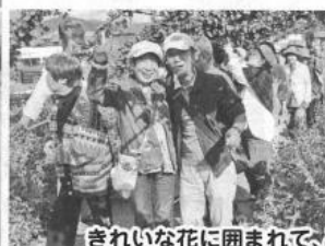
きれいな花に囲まれて、とっても楽しそうですね♡