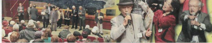
カラオケ出演者88組を、4・5ページで紹介しています