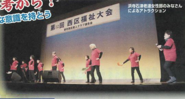
浜寺石津老連女性部のみなさんによるアトラクション