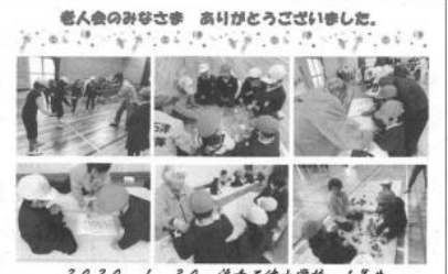
2020.1.30 浜寺石津小学校 1年生