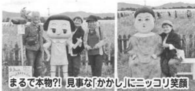
まるで本物?! 見事な「かかし」にニッコリ笑顔

今年度の研修旅行は、西 区老連役員と女性部が合同 で、日本酒と地ビール工場 「黄桜伏水蔵」、「丹波亀岡 夢コスモス園」、「八つ橋庵 とししゅうやかた」に行っ てきました。