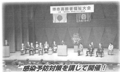
感染予防対策を講じて開催!!

堺市老連主催による令和2年度堺市高齢者福祉大会が十月六日(火)フエニーチェ堺小ホールで開催されました。今年度は新型コロナウイルス感染症拡大防止に伴い、式典のみが行われ、マスクの着用、検温、アルコール消毒の徹底など未曾有の事態に創意工夫を凝らした大会となりました。