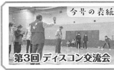
第3回 デイスコン交流会

11月12日(日)、原池公園体育館で第3回デイスコン交流会を開催しました。今年度は新型コロナウイルス感染症の影響で各種行事が軒並み中止・延期となりましたが、当日は3密回避、手指消毒の徹底など感染拡大予防策を講じた上で75名の選手が元気いっぱいのプレーを展開。会員同士の交流を深め、楽しいひとときを過ごしました。