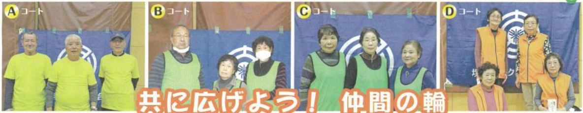
コート優勝の皆さん ※撮影時のみマスクを外しました。