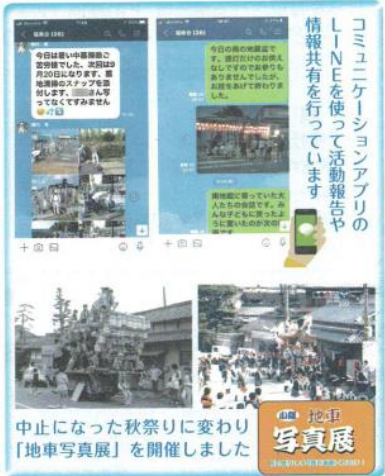
中止になった秋祭りに変わり「地車写真展」を開催しました

も行っています。この秋祭りが中止となったので「地車写真展」を開催しました。何十年前の写真が掲載され歴代の地車や若い頃の自分たちの姿を見て思い出を語り合いました。