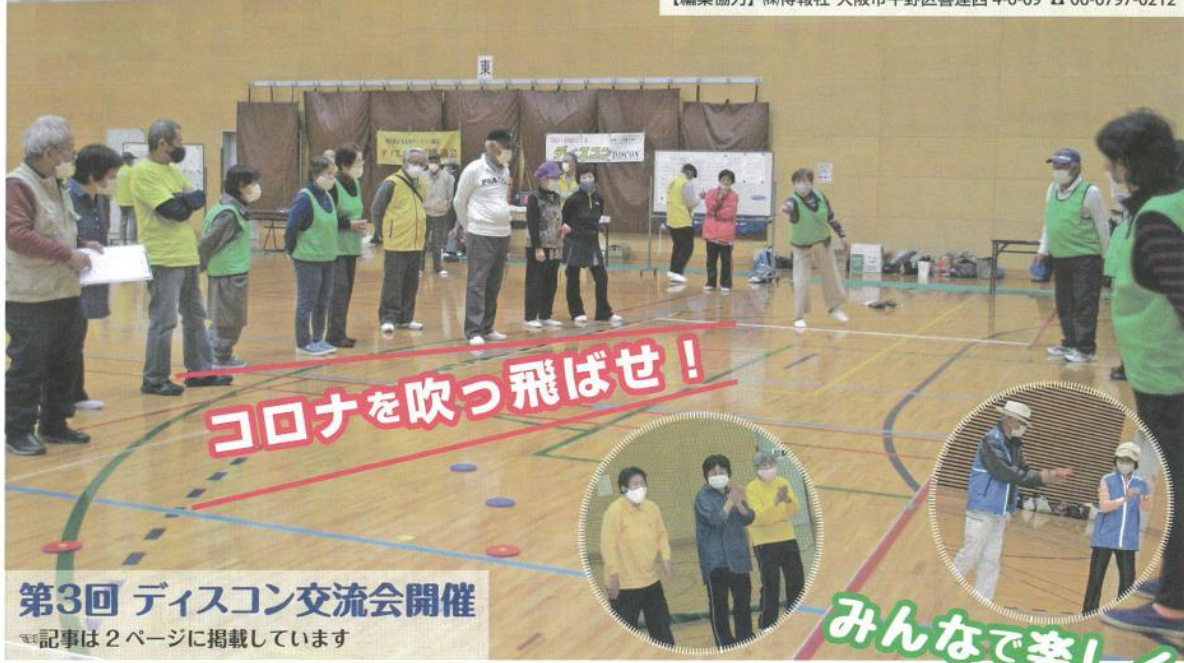
第3回 ディスコン交流会開催 ※記事は2ページに掲載しています