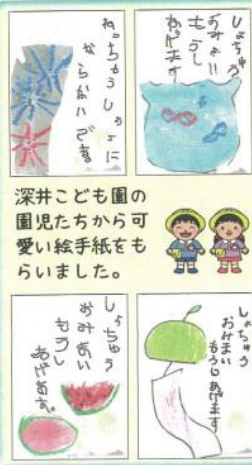
深井こども園の園児たちから可愛い絵手紙をもらいました。

再開後第一弾の行事である「第三回ティスコン交流会」です。三密を避けるべく、広い会場を使用し、コートあたりの参加人数を減らしました。これからも知恵をしぼりながら、会員同士の交流を深める行事を開催していきますので、是非ご参加ください。みんなで楽しくやりましょう!