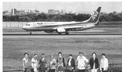
私たちは、堺市東区老人クラブ連合会の活動を応援しています