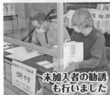
未加入者の勧誘 も行いました

9月16日、17日の2日間、北余 部自治会より敬老の日にちなみ、お祝 い品を贈呈する催しが北余部区民会館 で行われました。私たち老人クラブ役 員も手伝います。そして地域にお住 まいの未加入者の方への会員勧誘活動も 同時に行います。