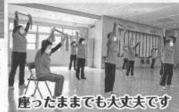
座ったままでも大丈夫です

毎週水曜日、北余部区民会館で 活動をしている北余部チューブ体 操部です。現在は1・3週の班と2・ 4週の班でメンバーを半分に分け、 また活動時間を90分から60分に短縮して部を再開しました。