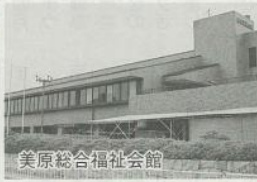
美原総合福祉会館