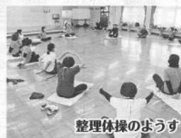
整理体操のぼうず

で血行を促しながら徐々に筋肉をクールダウンさせて全てのメニューが終了です。参加した皆さんは「出かけんから体がなまってる」「良い汗かいたわー」と楽しいひと時を満喫した様子。すっきりとした表情でセンターを後にしました。