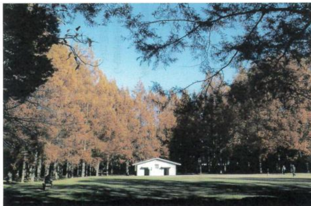
<メタセコイヤ>新檜尾公園 (2020年11月) 西上 義次