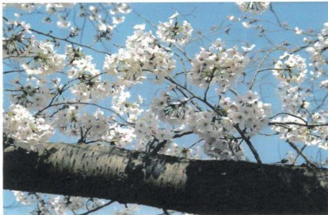
<桜>甲斐田川 (2020年4月) 美木多校区 西上 義次