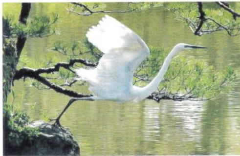
コロナのない世界に飛び立とう 御池台校区 由肥 忠義