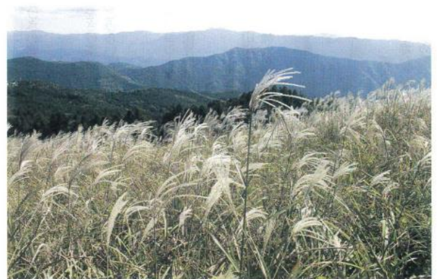
<ススキ>生石高原 (2020年10月) 西上 義次