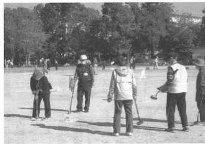
109名が参加してグラウンドゴルフ大会開催

11月17日(火)、南区老連第29回グラウンドゴルフ大会が西原公園グラウンドで109名が参加して行われました。