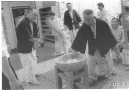
榎尾交遊クラブ泊旅行 (ホテルのイベント参加、2012年5月)