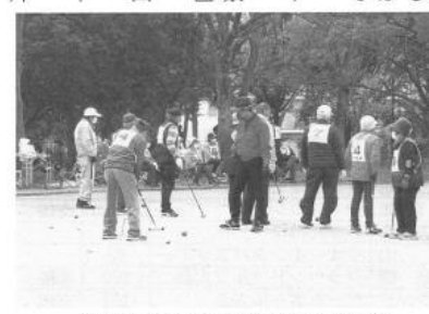
庭代グラウンドで105名が参加し開催