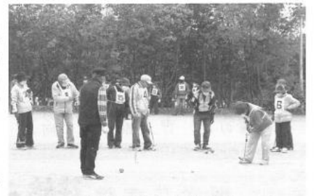
暑さもものは、100名が熱戦

2020年9月28日(月)、第29回グラウンドゴルフ大会開催された。また暑さのある中、友好大会が開催されました。