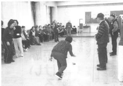
昨年のディスコン競技大会のもよう

試合の流れの中で歓喜や拍手、時にはため息、ハラハラドキドキしながらも、終始和やかに競技が行われていました。 入賞したチームには市老連からの贈りものが配られました。 ディスコン競技は体に負担をかけることが少なく、適度な運動ができるので、健康づくりに、仲間づくり、介護