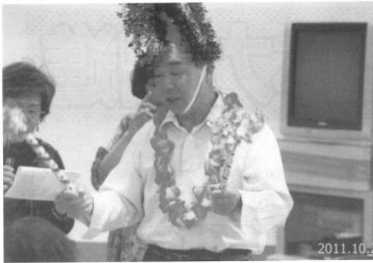
榎尾交遊クラブ音楽会 (2011年10月)