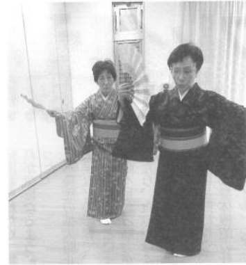
月4回実施中の日本舞踊の会