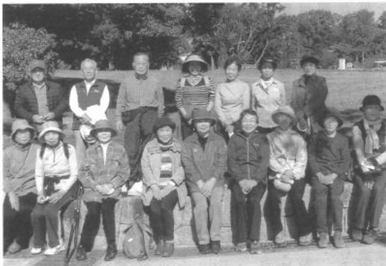
大蓮公園まで楽しくウォーキングして全員完歩