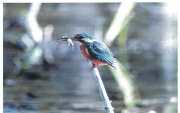
<カワセミ>御池台校区 丸木 利明