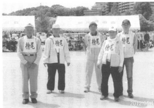
美木多校区自治連合会体育祭 (ゲートボール参加、2012年5月)