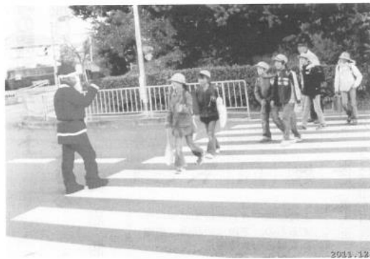
子ども見守り活動 (2011年12月)