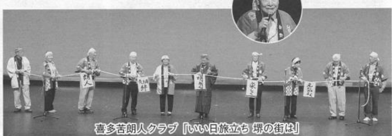
喜多苦朗人クラブ 「いい日旅立ち 堺の街は」