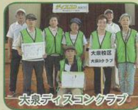
大泉ディスコンクラブ