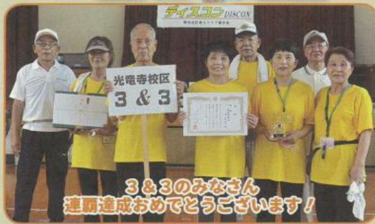
3&3のみなさん 連覇達成おめでとうございます！