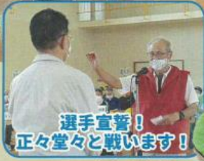
選手宣誓！ 正々堂々と戦います！