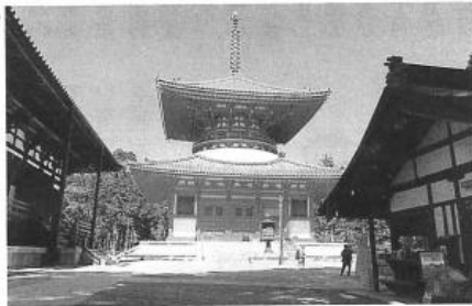
冬は初詣・雪景色、春は新緑シャクナゲ・青葉祭、夏は口ウソク祭、秋は紅葉と四季折々に楽しめます。

ルの山上盆地に千二百年前に弘法大師・空海が開山した真言密教の聖地があります。山上には四千人(内千人は坊さん)の人が住むと言ふ宗教都市があるのに驚かされます。高野山は二〇〇四年には世界遺産に登録され、外国の観光客も増加しています。総本山金剛峯寺を中心に一七の寺院があり半分は宿坊を兼ねています。