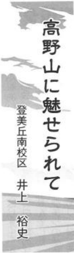
登美丘南校区 井上 裕史

私が高野山に初めて行ったのは五十年前の講習会でした。それ以降高野山には年二から三回、多い年は五回も行ききました。電車やケーブル、バス利用が楽ですが車で行くこと紀ノ川を渡りシグザグの道路を登って、高野山入口の大門に着きます。振り返ってみると山また山の秘境に來たかと思われ、この千メートルの峰々に囲まれた八百メートル