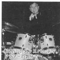
船内にてダンスパーティー。ドラマーの気分

夕暮れ迫る神戸港。ブラ スバンドと七色のテープに 見送られ、ドラの音を聞き ながら静かに岸壁を離れる 「飛鳥II」。全長二六八m、 重量五万二四二トンの豪華 客船アツキには異国人や沢 山の人がシャンパン片手に 見送る人たちとしばしの別 れ。百万ドルの夜景を背に 船は一路大阪湾、紀伊水道 を南下、本州最南端の潮岬 灯台を過ぎると太平洋の大